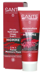
fluide hydratant 50ml 13,00€