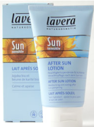
lait après soleil 150ml 9,00€