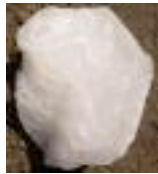
pierre brut 120gr 4,50€

Le cristal d'alun : Il se compose de sel de potassium d'alunite, extraite de carrières. C'est un anti-transpirant, antiseptique, il élimine les odeurs et apaise le feu du rasoir . Ce cristal était déjà utilisé dans l'antiquité. Les Romains utilisaient ces cristaux pour l'hygiène et sur les petites coupures, pour son effet cicatrisant (mouiller la pierre avant utilisation).