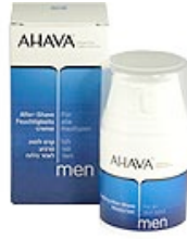
baume après-rasage 50ml 32,70€