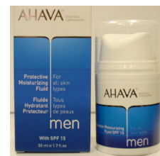
fluide hydratant IP15 50ml 38,30€