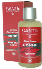
lotion après-rasage 100ml 15,00€